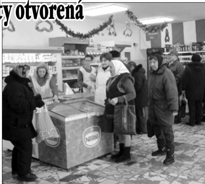
● Predajňa COOP Jednota ponúka svojim zákazníkom nielen výhodné akciové ceny, ale aj kvalitné produkty vlastnej značky.

oživila otváracie príhovory vianočnými piesňami a vinšami. Slávnostné otvorenie novej predajne si nenechalo ujsť zhruba 30 zákazníkov. Otváracie hodiny novej predajne v mesiaci december sú v pracovné dni a sobotu od 7.00 do 12.00 a od 12.30 do 18.00 h. V nedeľu bude otvorené od 8.00 do 12.00 h. COOP Jednota žela všetkým svojim zákazníkom, aby sa im v novej predajni dobre nakupovalo a zároveň príjemné prežitie vianočných sviatkov. (red)