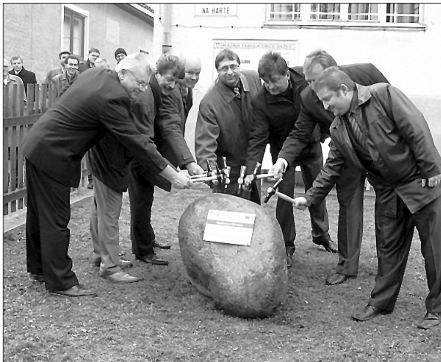
● Poklepanie základného kameňa „Kanalizácie a čistiarne odpadových vôd v obci Važec“.

„Obce ako akcionári určujú fungovanie spoločnosti a môžu požadovať od spoločnosti, ako sa má správať na trhu. U nás nepožadujú tvorbu zisku, ideme na vyrovnanom rozpočte a cena sa riadi tým, že pokrýva náklady. Aj z tohto dôvodu spoločnosť nemôže garantovať výšku ceny na niekoľko rokov dopredu, pretože ak sa zvýšia náklady, cena sa musí upraviť. A naopak, ak sa vstupy nezmenia, nie je dôvod zvyšovať cenu. Existuje i možnosť umelo znížiť cenu, čo však môže byť likvidačné. Cenotvorba je celkovo chúlостivá záležitosť a dvojsečná zbraň. Ak sa cena nezvyšuje, môže to znamenať stagnáciu a úpadok, ak by sme cenu za vodu výrazne zvýšili pri zachovaní fixných nákladov, ľudia začnú šetriť a v konečnom dôsledku sa náš príjem zníži. Úrad pre reguláciu však určuje aj maximálnu možnú mieru nárastu ceny – tento rok u vodného nebol dovolený nárast a u stočného bol do 5 %. Obvykle sú tieto čísla na úrovni 2 až 4 %, čo prakticky bežný zákazník veľmi nepocíti. A zároveň si dovoľm podotknúť, že to, čo je lacné, si ľudia nevážia,“ uviedol riaditeľ LVS. (mm)