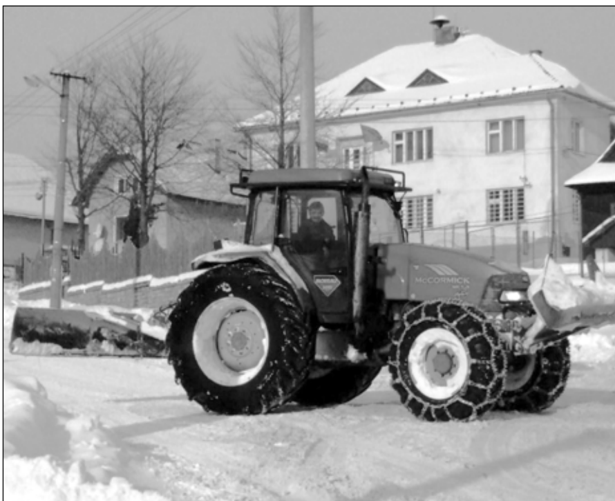
● V súčasnom období sa cesty dajú udržiavať v dobrom stave. Podľa usmernení vedúceho obecného podniku sa vodiči traktorov snažia rozširovať najdôležitejšie križovatky.

Ospravedlnenie: V minulom čísle Vážeckých novín na str. 5 došlo k výpadku časti záverečného slova v rozhovore s predsedom urbáru (kon-). Posledná veta v úplnom znení mala vyzeráť: „ Postupne sa budeme týmito plánmi zaoberať konkrétnejšie “. Za technickú chybu sa ospravedľujeme.