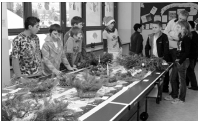
● Žiaci pri rozhodovaní o najkrajšej ikebane.

Správna výživa sa nemalou mierou podieľa na zdravotnom stave ľudí, ovplyvňuje kvalitu a dĺžku života a v detskom veku zdravý rast a vývin. Je veľmi dôležité, aby sa už školáci skamártili so zásadami zdravého stravovania a zdravého životného štýlu. Preto sme v škole zorganizovali týždeň zdravej výživy. Žiaci robili projekty o zdravej výžive, pripravovali si zdravé jedlá a formou hier sa dozvedali, aké bohatstvo sa skrýva v ovocí a zelenine a aký dôležitý je zdravý životný štýl. Žiaci si v rámci projektu o zdravej výžive vyskúšali prípravu chuťoviek, mís a šalátov z čerstvej zeleniny a ovocia, besedovali o zdravej výžive a správnom pitnom režime, v triedach si vytvorili kútiky zdravej výživy a na chodbách výstavy jesenných plodov a pripomenuli si vedomosti o hygienických návykoch pred jedením, kultúre stolovania a význame pohybu pre zdravý život.