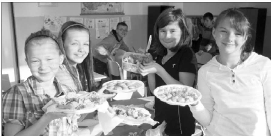
● Pri príprave zdravých jedál si deti užili aj veľa zábavy.