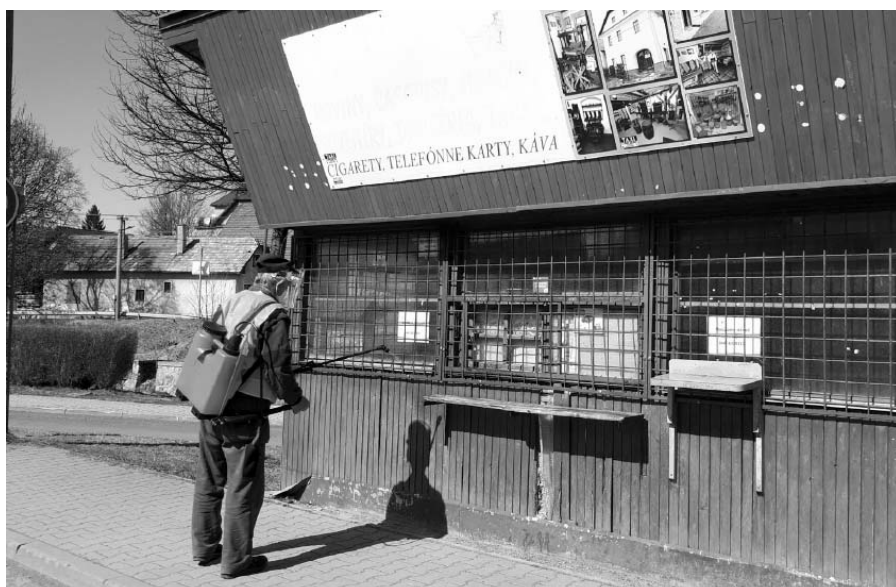
• Dezinfekcia verejných priestranstiev.

- V osade Dolinka boli testovaní dvaja obyvatelia, s negatívnym výsledkom. Bohužiaľ, reálny počet obyvateľov v uvedenej lokalite nie je známy. Na trvalom pobyte dvoch súpisných čísel, ktoré tvoria lokalitu (č. 990 a č. 991) je prihlásených 134 obyvateľov. Oslovili sme políciu za účelom zmapovania situácie ohľadom počtu zdržiavajúcich sa obyvateľov v osade, dostali sme ale odpoveď, že tento postup by bol protizákonný a protiústavný.