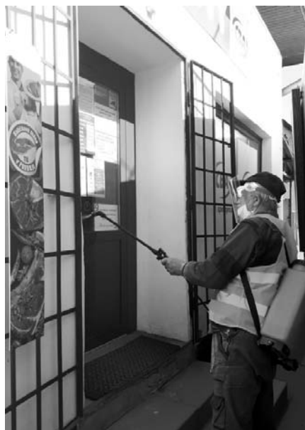
• Dezinfekcia verejných priestranstiev.

- Na obecnom zastupiteľstve konanom 28. apríla sme sa dohodli, že sviatočný víkend, v ktorom mali byť plánované oslavy 740-teho výročia založenia našej obce s vystúpením Kollá-