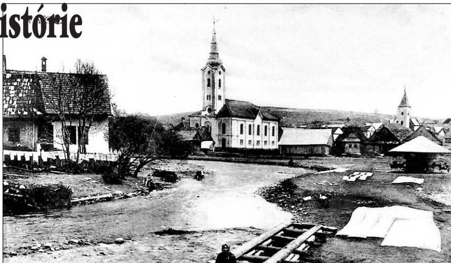
● Starý Važec pred rokom 1931.