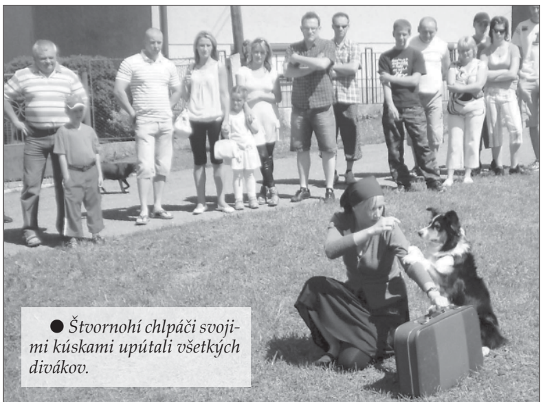
● Štvornohí chlपáci svojimi kúskami upúťali všetkých divákov.