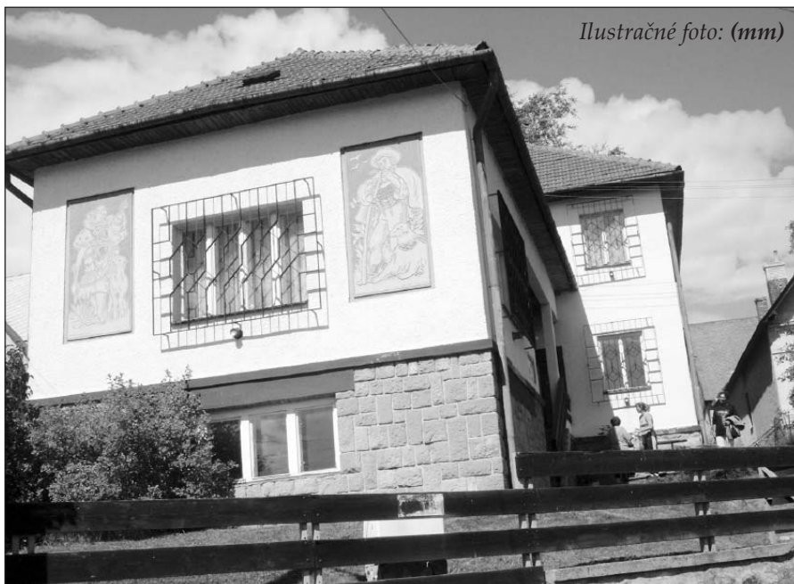
Ilustračné foto: (mm)

Obecné zastupiteľstvo prijalo návrh Z. Gažíkovej a podľa zmluvy sa obec bude podieľať na prevádzko-