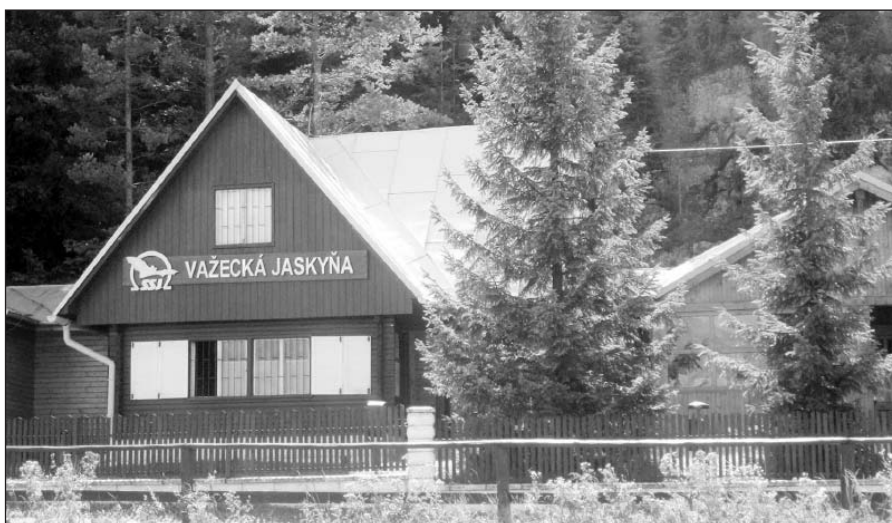
● Súčasné označenie Važeckej jaskyne.