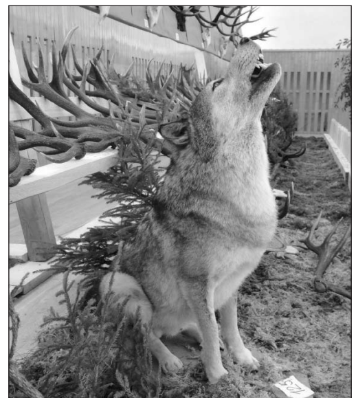
● Vlk obsadil v súťaži o NAJ trofej druhú miesto.