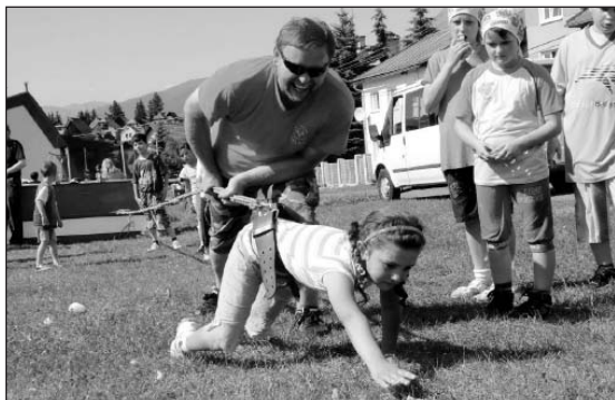
● Silu bungee lana sa pokúšali prekonať deti a dospelí.