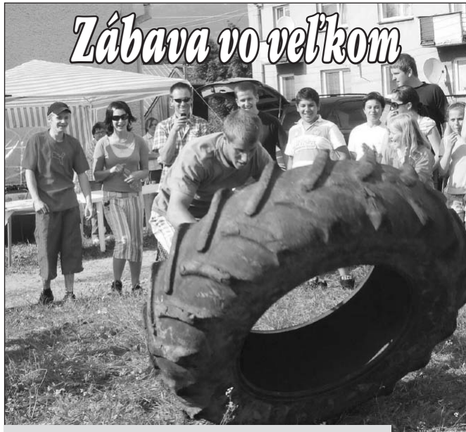
● V jednej zo siláckych súťaží chlapi súperili s pneumatikou...

Nočný pokoj sa stanovuje v zimnom období od 1. októbra do 31. marca od 22:00 do 05:00 hod. a v letnom období od 1. apríla do 30. septembra od 23:00 do 05:00 hod.