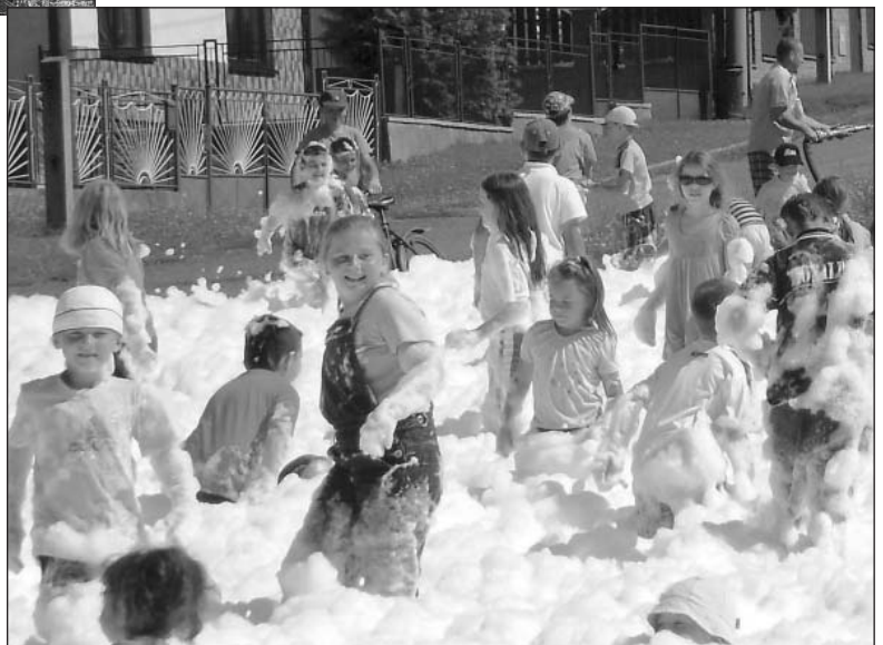
● Zábava v hasičskej pene...

Porušenie ustanovenia VZN právnickou alebo fyzickou osobou oprávnenou na podnikanie sa postihuje pokutou do výšky 6 638 €. Občanovi možno za porušenie VZN uložiť pokutu vo výške 33 €, ak konanie nie je trestným činom.