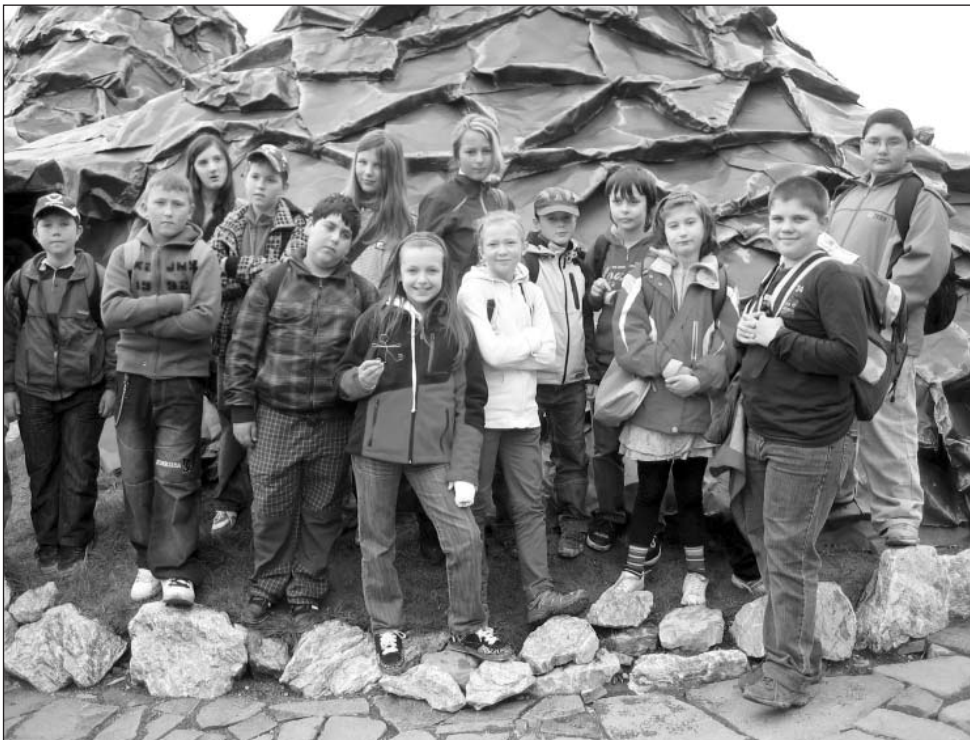
● Koncoročný školský výlet v rozprávkovom mestečku Habakuky.