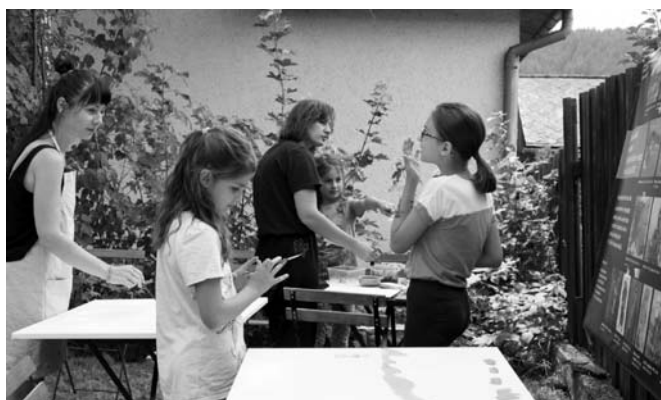
• Maľovanie obrazov počas sympózia si prišlo vyskúšať aj pár občanov obce.