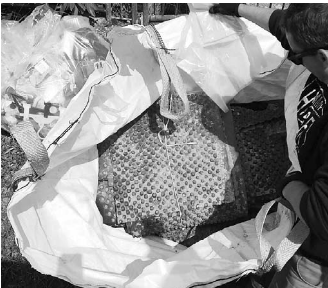
• V komunálnom odpade pracovníci nachádzajú rôzne veci, ktoré tam nepatria.

Systém odpadového hospodárstva v mestách a obciach na Slovensku je nastavený tak, aby sme boli motivovaní k separácii. Aj keď nie formou adresnej zľavy na poplatku za odpad pre tých, ktorí separujú, ale zatiaľ formou kolektívnej zodpovednosti. Minulý rok vstúpil na Slovensku do platnosti nový zákon, ktorý nastavil pravidlá tak, že výška poplatku za uloženie tony odpadu na skládke sa pre mestá a obce mení podľa toho, koľko odpadu vyprodukujú. Čím menej KO vyprodukujú, tým menej zaplatia za každú uloženú tonu na skládku a naopak. Preto je pre nás dôležitým