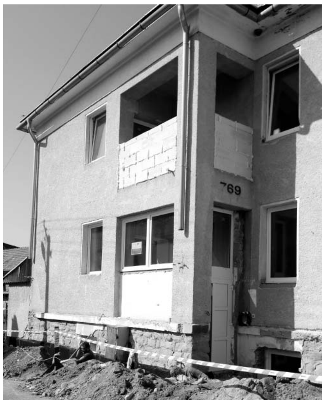
• Rekonštrukcia Miestneho kultúrneho strediska.

Dlhodobejším projektom je rekonštrukcia Miestneho kultúrneho strediska, ktoré obec rekonštruje v rámci projektu na zvýšenie energetickej efektívnosti verejných budov. Celková výška oprávnených nákladov je takmer 123-tisíc eur, z toho necelých 117-tisíc eur obec získa z projektu ako nenávratný finančný príspevok a výška spolufinancovania z vlastných zdrojov obce je niečo vyše 6-tisíc eur. Plánovaná je výmena okien, dverí, zateplenie, odizolovanie odvodových múrov, rekonštrukcia vykurovania a elektroinštalácií a strechy.