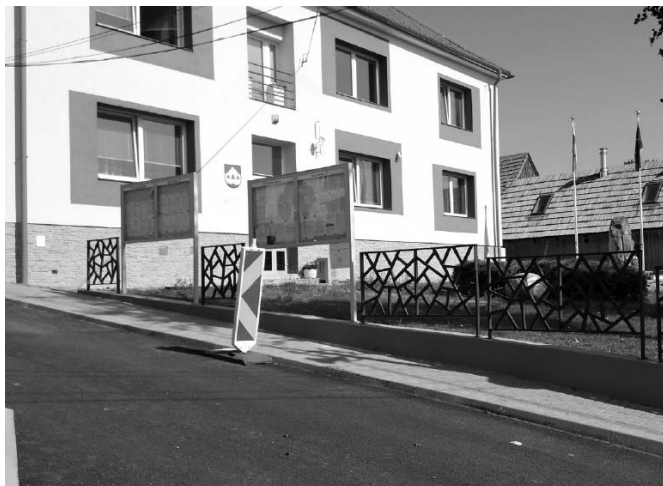
• Okolie obecného úradu sa postupne obnovuje.

Popri základnej rekonštrukcii obec plánuje podľa dostupnosti vlastných finančných zdrojov pridať aj iné práce v interiéri, napríklad rekonštrukcia omietok, podláh a podobne. Doteraz sa financovali stavebné práce v hodnote 42-tisíc eur a služby v hodnote 1 320 eur (stavebný dozor, projektant). Výdavky mimo projekt financované z vlastných obecných zdrojov sú zatiaľ niečo vyše 17-tisíc eur.