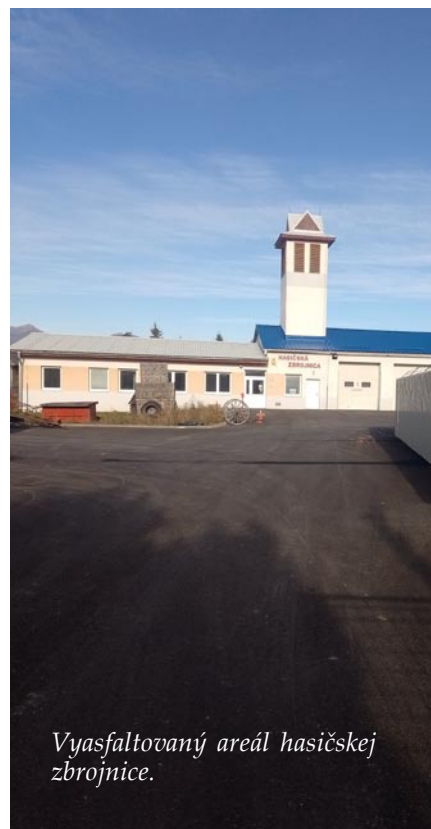
Vyasfaltovaný areál hasičskej zbrojnice.