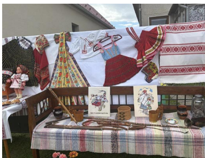
Výzdoba domu počas chorovodu Omilienci na ulici Hlavnej (rod. Jurčová).