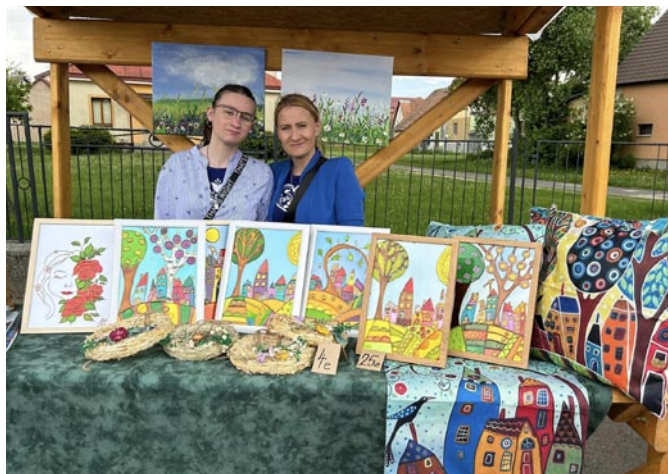
Šikové žienky ponúkali vlastnoručne vyrobené dekorácie.