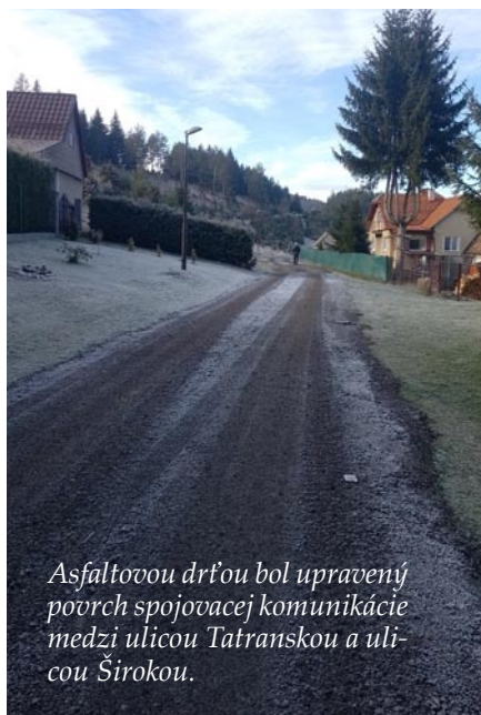
Asfaltovou drťou bol upravený povrch spojovacej komunikácie medzi ulicou Tatranskou a ulicou Širokou.

Najväčšou tohtoročnou investíciou bola úprava areálu hasičskej zbrojnice. „Keďže v susedstve zbrojnice sme vybudovali zberný dvor, ktorého areál je upravený a vyasfaltovaný, považovali sme za vhodné upraviť aj priestory pre hasičov. Z praktického aj morálneho hľadiska si myslím, že to bola vhodná investícia, naši dobrovoľní hasiči sú aktívni, nielenže si to zaslúžia, ale aj vzhľadom na využívanie ťažkej techniky by malo byť dobré technické zázemie samozrejmosťou,“ zhrnul starosta