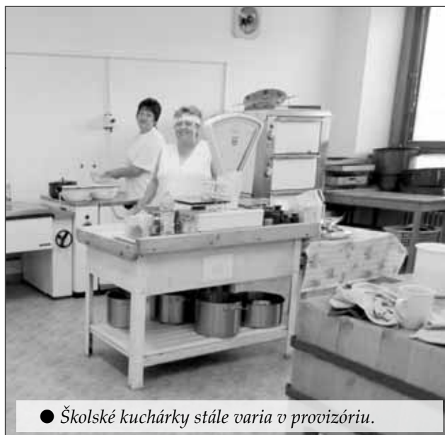
● Školské kuchárky stále varia v provizóriu.