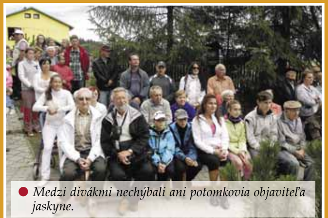
● Medzi divákmi nechýbali ani potomkovia objaviteľa jaskyne.