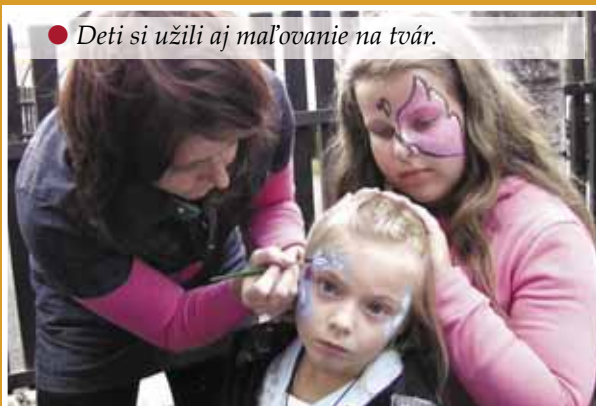
• Deti si užili aj maľovanie na tvár.