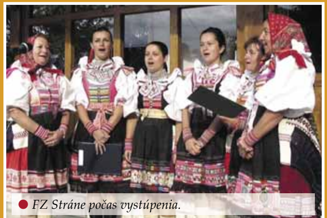
● FZ Stráne počas vystúpenia.