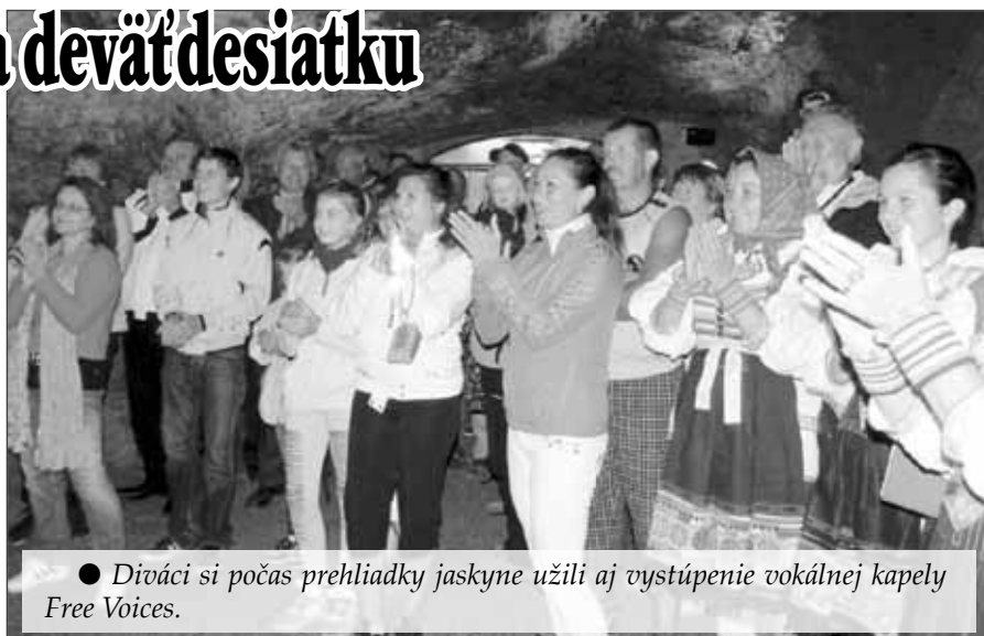
● Diváci si počas prehliadky jaskyne užili aj vystúpenie vokálnej kapely Free Voices.