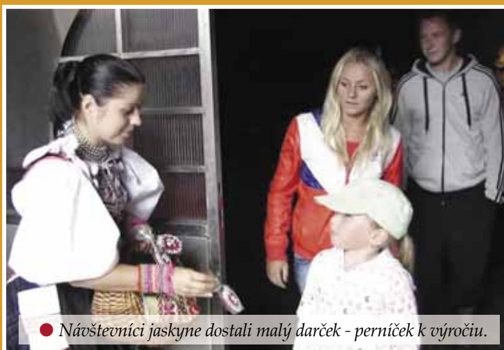
• Návštevníci jaskyne dostali malý darček - perniček k výročiu.