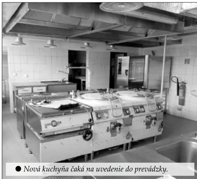
● Nová kuchyňa čaká na uvedenie do prevádzky.

Novinky, ktoré určite túžobne očakávali nielen žiaci a učitelia, ale aj pracovníci školskej jedálne a materskej školy, sa zatiaľ realitou nestali. Kolaudácia nového pavilónu školy nebola kvôli zisteným nedostatkom zatiaľ úspešne ukončená. „Kolaudácia bola vyhlásená v stanovenom termíne, ale keďže zhotoviteľ načas nedodal protipožiarnu dvere, vybavenie počítačovej miestnosti a niekoľko ďalších drobností, musela byť prerušená. Dôvodom tohto stavu bol problém s financovaním. Keďže nám ministerstvo zastavilo všetky platby na projekt, neuhradili sme faktúry zhotoviteľovi, ktorý sa dostal do finančných problémov. Z toho dôvodu bola obec nútená zobrať si aj preklenovací úver vo výške 300 tisíc €, aby sme mohli zaplatiť dodávateľom za vykonané práce. Podľa dostupných informácií k problémom došlo z toho dôvodu, že ministerstvo schválilo viac projektov na rekonštrukciu škôl v oveľa vyššom objeme financií, aký mali k dispozícii. V súčasnosti nás už informovali, že údajne sa podarilo nájsť financie na preplatenie projektov a situácia by sa mala vyriešiť v priebehu niekoľkých mesiacov. Verím, že kolaudáciu úspešne ukončíme do konca októbra a budeme môcť spustiť budovu do prevádzky,“ povedal starosta obce Rastislav Profant.