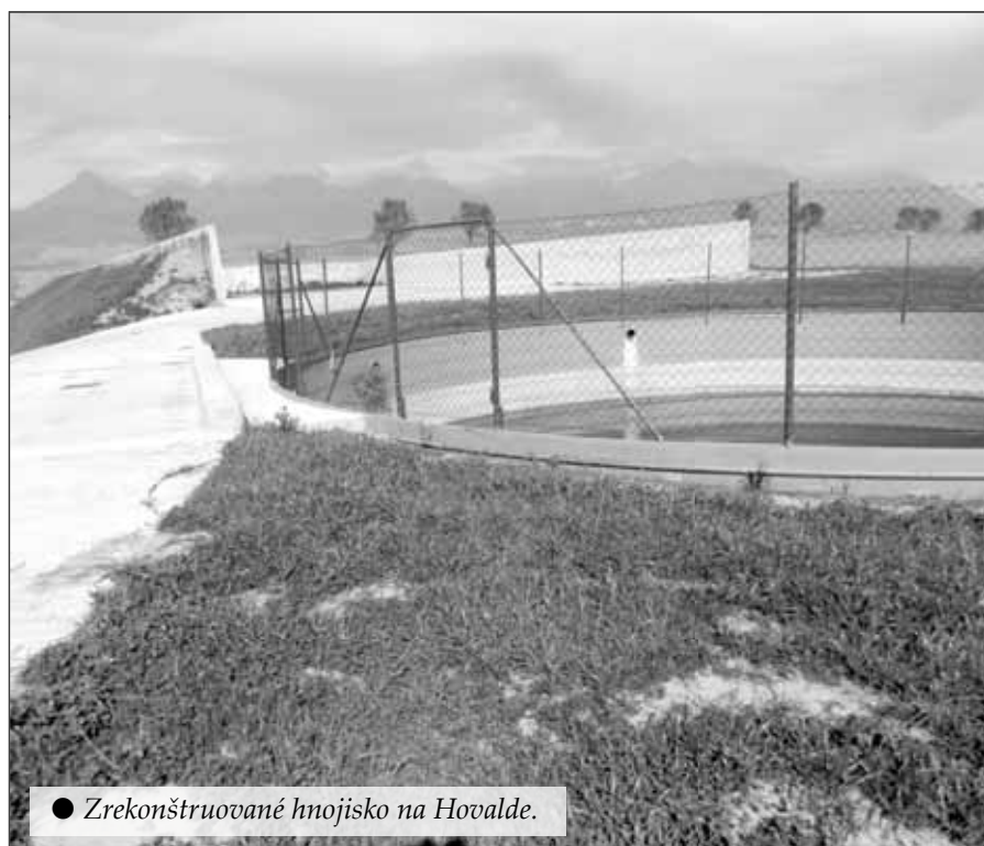
● Zrekonštruované hnojisko na Hovalde.