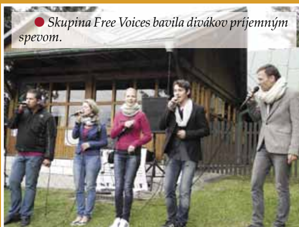
• Skupina Free Voices bavila divákov príjemným spevom.