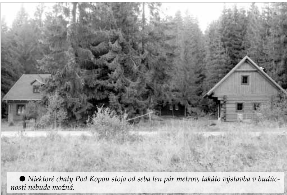
● Niektoré chaty Pod Kopou stoja od seba len pár metrov, takáto výstavba v budúcnosti nebude možná.

Hlavným cieľom vypracovania urbanistickej štúdie bolo zhodnotenie súčasného stavu existujúcich chat a vymedzenie presných hraníc budúceho oficiálneho rekreačného priestoru, ako aj zosúladenie funkčného priestoru medzi Územným plánom VÚC Žilina a Územným plánom obce Važec a skutkovým stavom. Do návrhu boli zakomponované všetky existujúce chaty v tejto oblasti, legálne aj nelegálne, ktoré sa musia dodatočne zlegalizovať. Dva z nelegálnych objektov musia byť premiestnené.