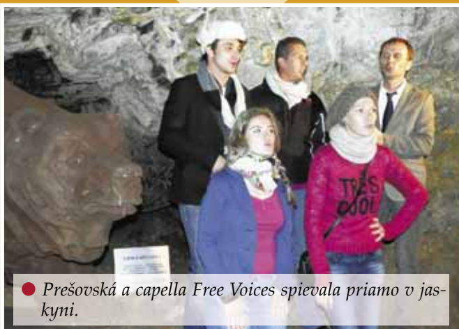
● Prešovská a capella Free Voices spievala priamo v jaskyni.