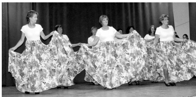
• Tanečná skupina Šumienky z Dovalova zaujala tanečným vystúpením.