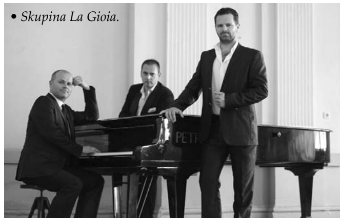
• Skupina La Gioia.

Veríme, že sa nás v poslednú adventnú sobotu stretne na námestí čo najviac. Tešíme sa na vás!