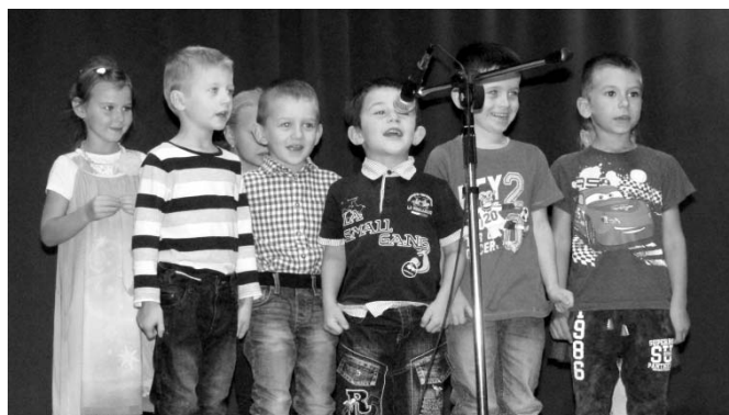
• Deti z materskej školy recitovali, čo im síly stačili. ☺

Hodnotnú a peknú akciu mali členovia miestnej Jednoty dôchodcov v základnej škole pri príležitosti mesiaca úcty k starším a rozvíjania čitateľskej gramotnosti detí. Žiaci prvého stupňa za asistencie učiteľky Viery Jakúbekovej čítali starým mamám rozprávky z čítaniek. V krátkej besede sme rozprávali deťom o tom, aké rozprávky sme si čítali my, keď sme boli deti. I keď na začiatku bola tréma na oboch stranách, nakoniec sme konštatovali, že toto podujatie bolo veľmi kladné a že o rok si ho môžeme zopakovať. Členky JDS ďakujú vedeniu ZŠ i žiakom. (kl)