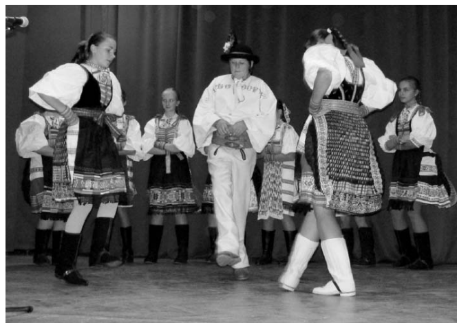
• DFS Podkriváňček predviedol bohaté pásmo piesní i tancov.