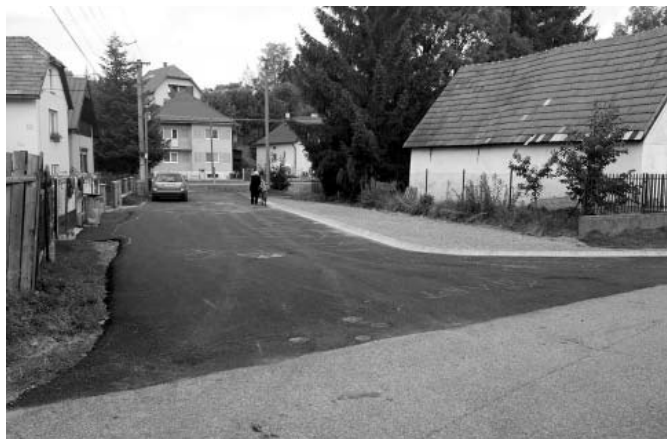
• Rozšírenie cestnej komunikácie na ulici Š. Rysuľu.