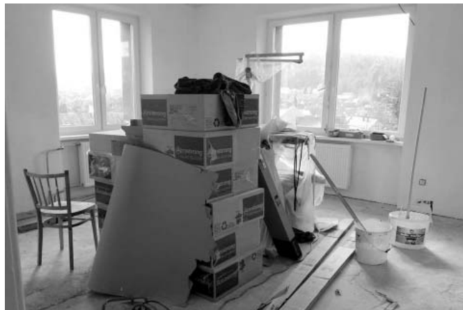
• Z rekonštrukcie obecného úradu.

Opravy miestnych komunikácií obec financuje z vlastného rozpočtu. Doasfaltovanie vozovky k odvodňovacím žlabom na Stankovom brehu a zaasfaltovanie ryhy na uliciach Š. Rysuľu a Pod Vilingom stáli 2 652 eur, opravy miestnych komunikácií tryskovou metódou (prístup do obce, krajnica vozovky na