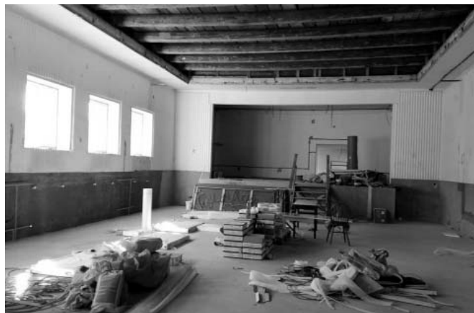
• Kinosála počas rekonštrukcie.