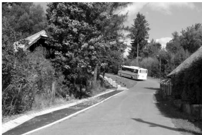
• Rozšírenie chodníka na Stankovom brehu.